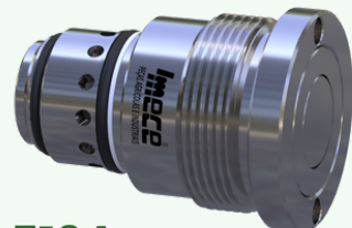
5194 - Eng. Cartucho Hidráulico Fêmea 9/16" Face Plana (SP) (AH225671 / AXE49949)