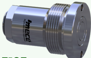
5195 - Eng. Cartucho Hidráulico Fêmea 3/8" Face Plana (SP) (AH225670 / AXE21789)