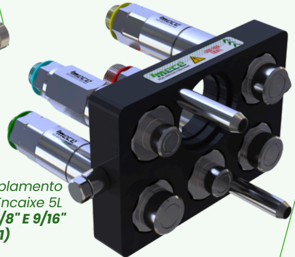
5166 - Multi Acoplamento Hidráulico Placa Encaixe 5L Engates Machos 3/8" E 9/16" (AH166991)