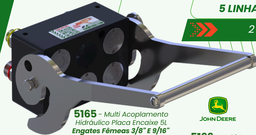
5165 - Multi Acoplamento Hidráulico Placa Encaixe 5L Engates Fêmeas 3/8" E 9/16" (AH219590)